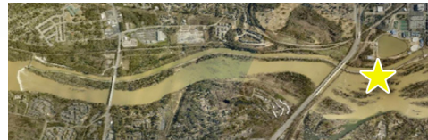
Figura 3: Vista aérea del canal de Columbia